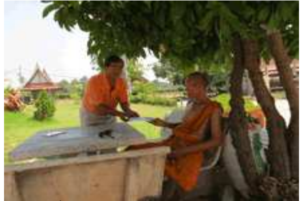
สภครณ์ฯ มอบเงินบริจาคแก่วัดจุฬามณี