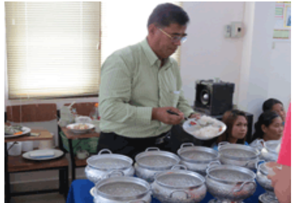
กรรมการฯ และเจ้าหน้าที่ฯ เข้าร่วมงาน“วันออมแห่งชาติ” กับชสอ.