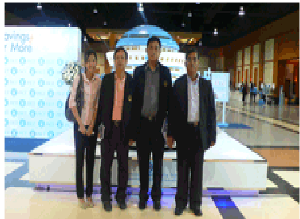
กรรมการฯ และเจ้าหน้าที่ฯ เข้าร่วมประชุมใหญ่สามัญ สอ.สร รัฐวิสาหกิจรถไฟ