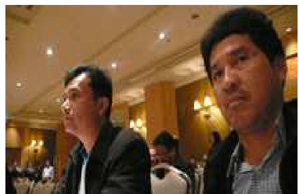
กรรมการฯ และผู้ตรวจสอบกิจการ ร่วมการเสวนาทางวิชาการ กับ สรส. ที่กรุงเทพฯ

การเสวนามีวัตถุประสงค์เพื่อให้ผู้เข้าร่วม การเสวนาได้รับทราบการดำเนินงานของ รัฐวิสาหกิจไทย นโยบายการแปรรูปรัฐวิสาหกิจของ กระทรวงการคลัง รวมทั้งสถานภาพของรัฐวิสาหกิจ ไทยในปัจจุบัน เพื่อรับทราบนโยบาย การลด สัดส่วนการถือครองหุ้นของ บมจ. ปตท. และ บมจ. การบินไทย กับผลกระทบต่อทั้งทางด้านเศรษฐกิจ การเมือง และสังคมความเป็นอยู่ของประชาชน เพื่อ เป็นเวทีระดมสมอง หาข้อสรุป เพื่อสร้างองค์ความรู้ ที่แท้จริงให้เกิดขึ้นว่า การแปรรูปรัฐวิสาหกิจนั้น ก่อให้เกิดผลดี ผลเสียต่อประเทศอย่างไรบ้าง จะได้ หาแนวทางปกป้องรัฐวิสาหกิจ ซึ่งเป็นทรัพย์สิน ของประเทศและประชาชน จากการแสวงหา ผลประโยชน์ในรัฐวิสาหกิจของกลุ่มอำนาจทุนที่ มักจะอ้างเหตุผลว่า รัฐวิสาหกิจเป็นภาระของรัฐบาล ที่ก่อให้เกิดหนี้สินสาธารณะ เป็นต้น